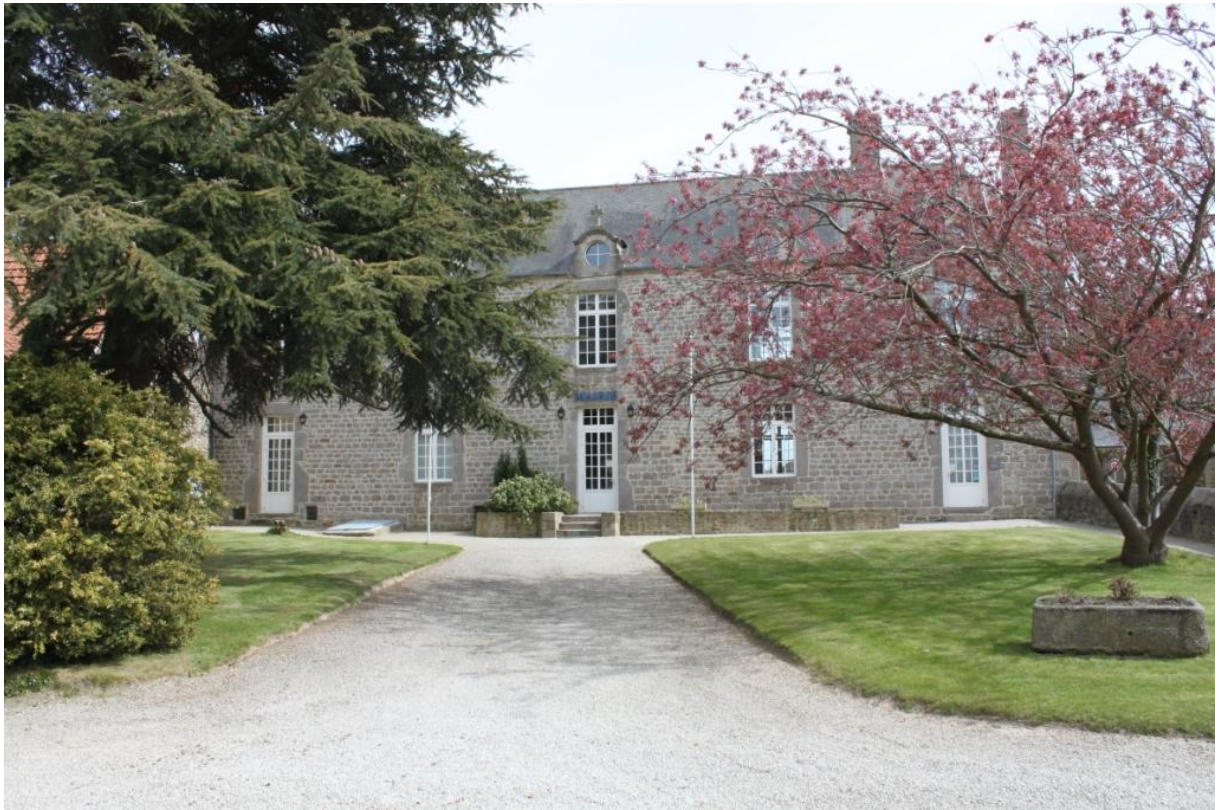
Ci-dessous l'ancienne mairie